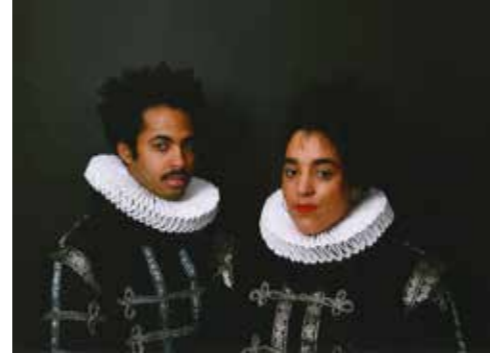
'DUTCH PLAY' door G en Salim Bayri. Photo Paper—A4 (2020). Langlopende samenwerking sinds hun ontmoeting op de Rijksakademie, deze foto komt uit hun gezamenlijke archief.