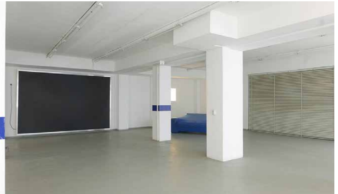
Kuypers & de Neef, Zaalzaanzicht 'Nothing to See' — Group exhibit op at Locatie Spatie, Arnhem — 2019