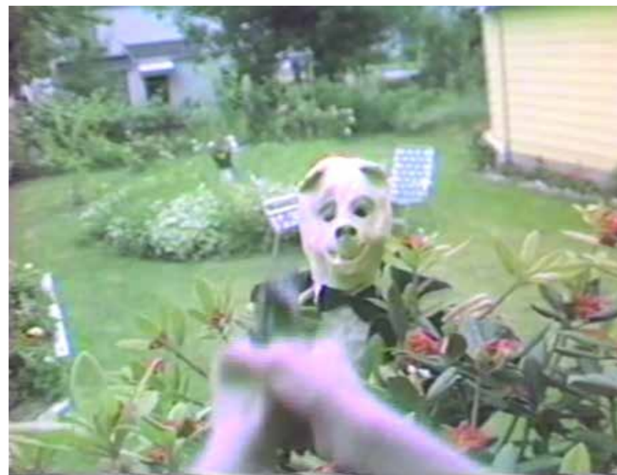
Cecilia Condit, Possibly in Michigan , 1983, film still.

#PossiblyInMichigan is niet alleen de titel van het in 1983 gemaakte experimentele videowerk van Condit en tevens onderdeel van de vaste collectie van het MoMA in New York, maar ook een hashtag met inmiddels meer dan 69.4 miljoen views op TikTok. Videokunstenaar Cecilia Condit is 73 jaar, én sinds kort een hit op deze onder jongeren fameuze app waar voornamelijk make-up tutorials, playback video's en memes van gemiddeld 15 seconden op verschijnen.