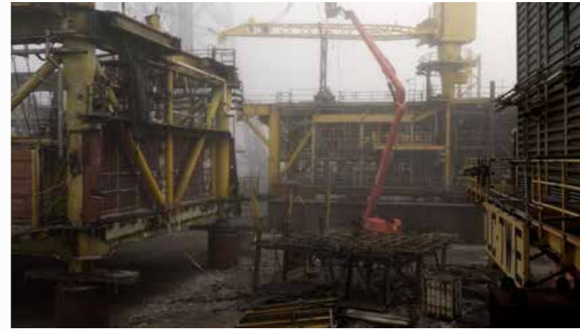
Decom (Installation shot) 2021, Video, loop 1'4"56", 4K / 16:9 Kleur. Collectie: De Nederlandsche Bank, Normec Group. Courtesy: Rijksakademie van beeldende kunsten / Galerie Caroline O'Brien, Photo: Sander van Wietum