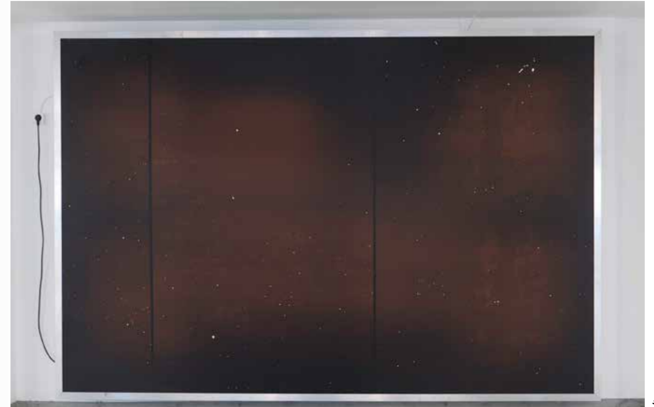
Kuypers & de Neef, Gall & Galaxy — Mdf, aluminium, T-lampen & vinyl — 2019