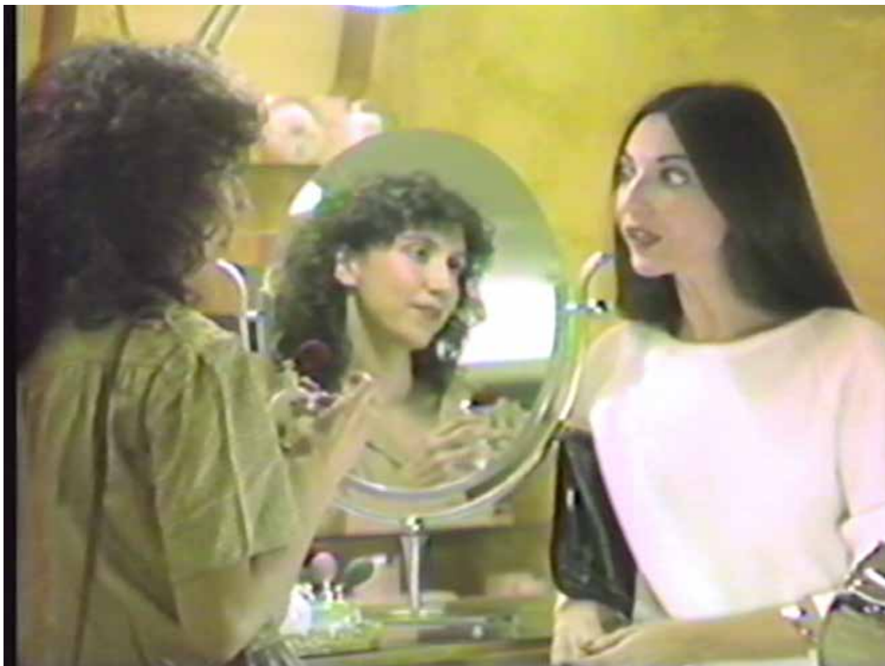
The brutal, surreal and darkly funny 1983 art/musical has, somehow, become TikTok tobbop

Je zou je kunnen afvragen hoeveel van de TikTok gebruikers zich er daadwerkelijk bewust van zijn dat ze een experimenteel videokunstwerk uit de jaren '80 als inspiratiebron hebben gebruikt, en of ze überhaupt wel weten wie het oorspronkelijke werk gemaakt heeft. Ergens is het ook ironisch dat een psychologisch diep gelaagd kunstwerk als Possibly in Michigan opeens het decor wordt van vluchtige, populaire cultuur. Desalniettemin vertelt het verhaal van een 73-jarige kunstenaar die opeens wereldberoemd is geworden onder generatie Z, dat een platform als TikTok misschien wel een toegankelijker publieke ruimte is dan het hermetisch afgesloten museum waar je 16 euro voor een toegangkaartje neer moet leggen.