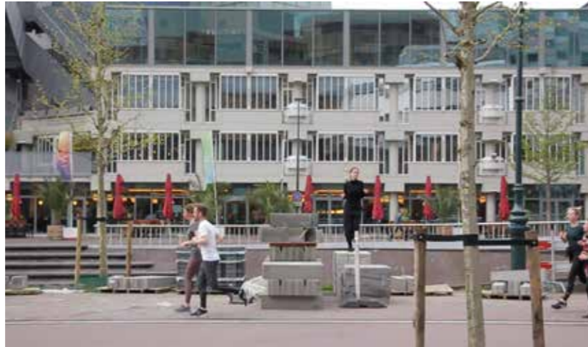
U_Centraal, 2021, Duration: 12'08" (loop), Format: Video FullHD/ 16:9 Colour