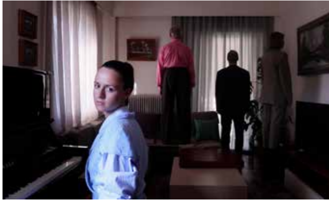
FAM, 2020, Duration: 03'27" (loop), Format: Video FullHD/ 16:9 Colour