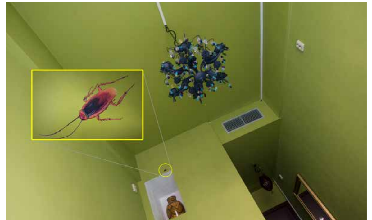
Oll Thief, 2018, 12 x 8 cm, Schilderij in hotelkamer n204 van hotel Bazar't en t'el, uap, 2018