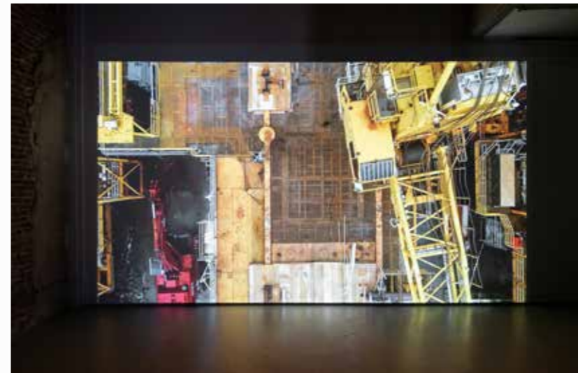
Decom (still), 2021, Video, loop 1'4"56", 4K / 16:9 Kleur. Collectie: De Nederlandsche Bank, Normec Group. Courtesy: Rijksakademie van beeldende kunsten / Galerie Caroline O'Brien