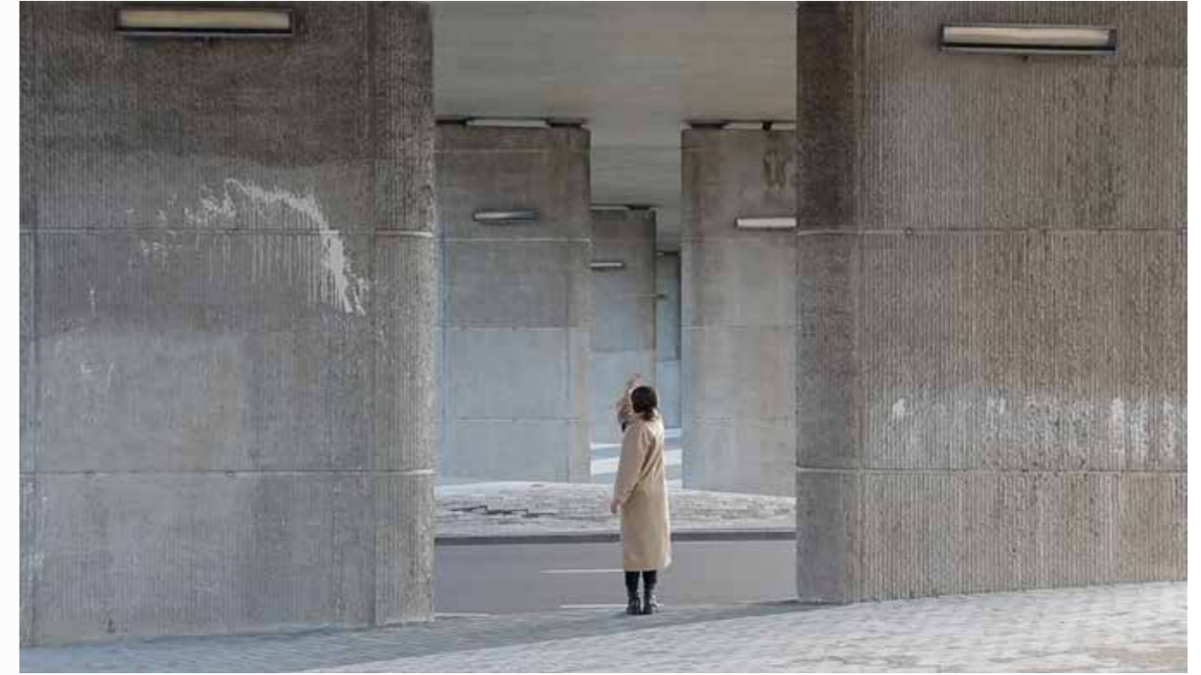
Bridge, 2021, Duration: 06'11" (loop), Format: Video FullHD/ 16:9 Colour

interventies is de beslissing om te focussen op lichaamsbeweging tegelijk een poging om het lichaam te onderzoeken. De openbare ruimte is hiervoor het ideale platform. In het onderzoeken van de relatie tussen het menselijk lichaam en zijn omringende ruimte, vraagt de kunstenaar zich af hoe ze elkaar vormen en in hoeverre ze vooraf zijn bepaald? Wie heeft er toegang tot en de keuzevrijheid om in ongeacht welke ruimte te doen of te zijn? Ze zet hiervoor zichzelf in maar ook het publiek dat, gevraagd en ongevraagd, onderdeel wordt van dit openbare beleid.