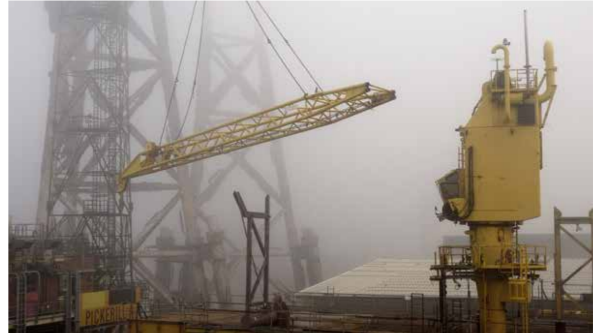
Decom (still), 2021, Video, loop 1'4"56", 4K / 16:9 Kleur. Collectie: De Nederlandsche Bank, Normec Group.