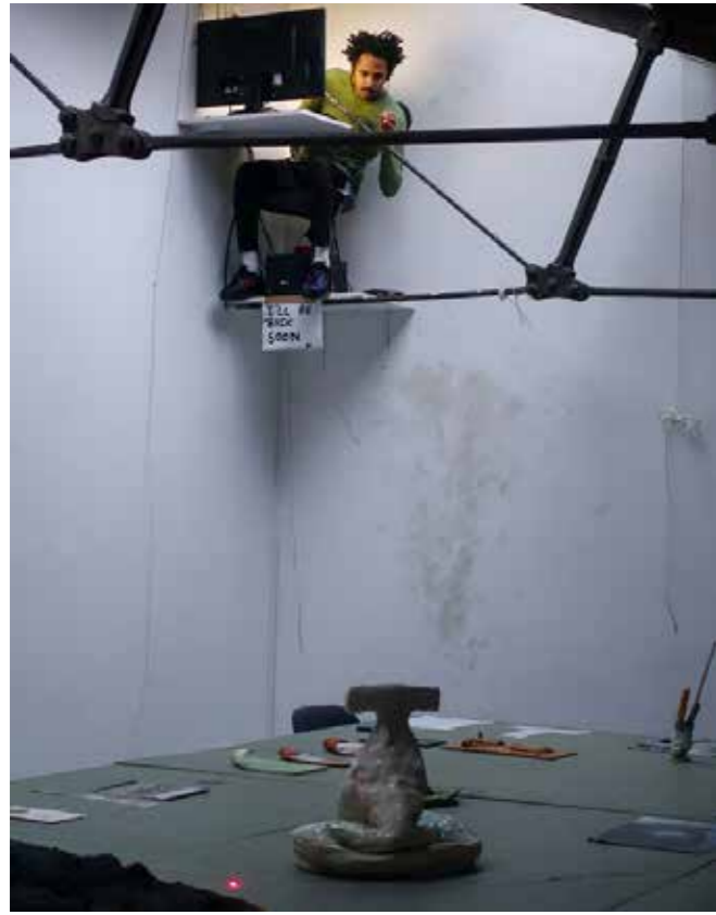
Corner Links, Tijdens de Rijksakademie Open, 2019. "Ik wilde mezelf vervreemden van wat ik had gemaakt en besloot mijn blik op de tael aan te passen om daarmee een geïmproviseerde stroom van nieuwe verhalen en onverwachte betekenissen uit te lokken."