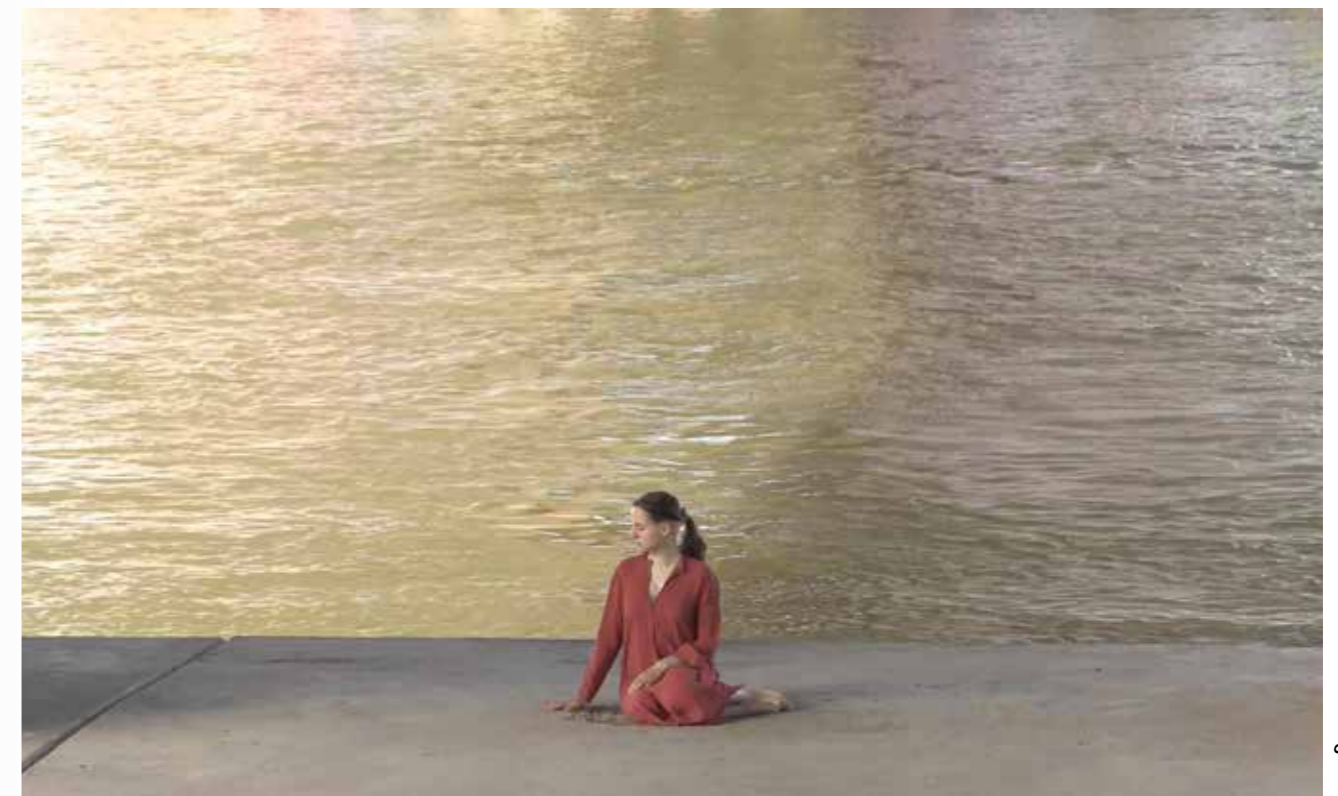
Space for the River, 2021, Duration: 06'43" (loop), Format: Video FullHD/ 16:9 Colour