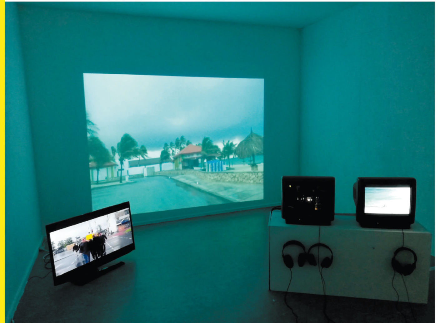
Eindexamenopstelling Fine Art ArtEZ '19