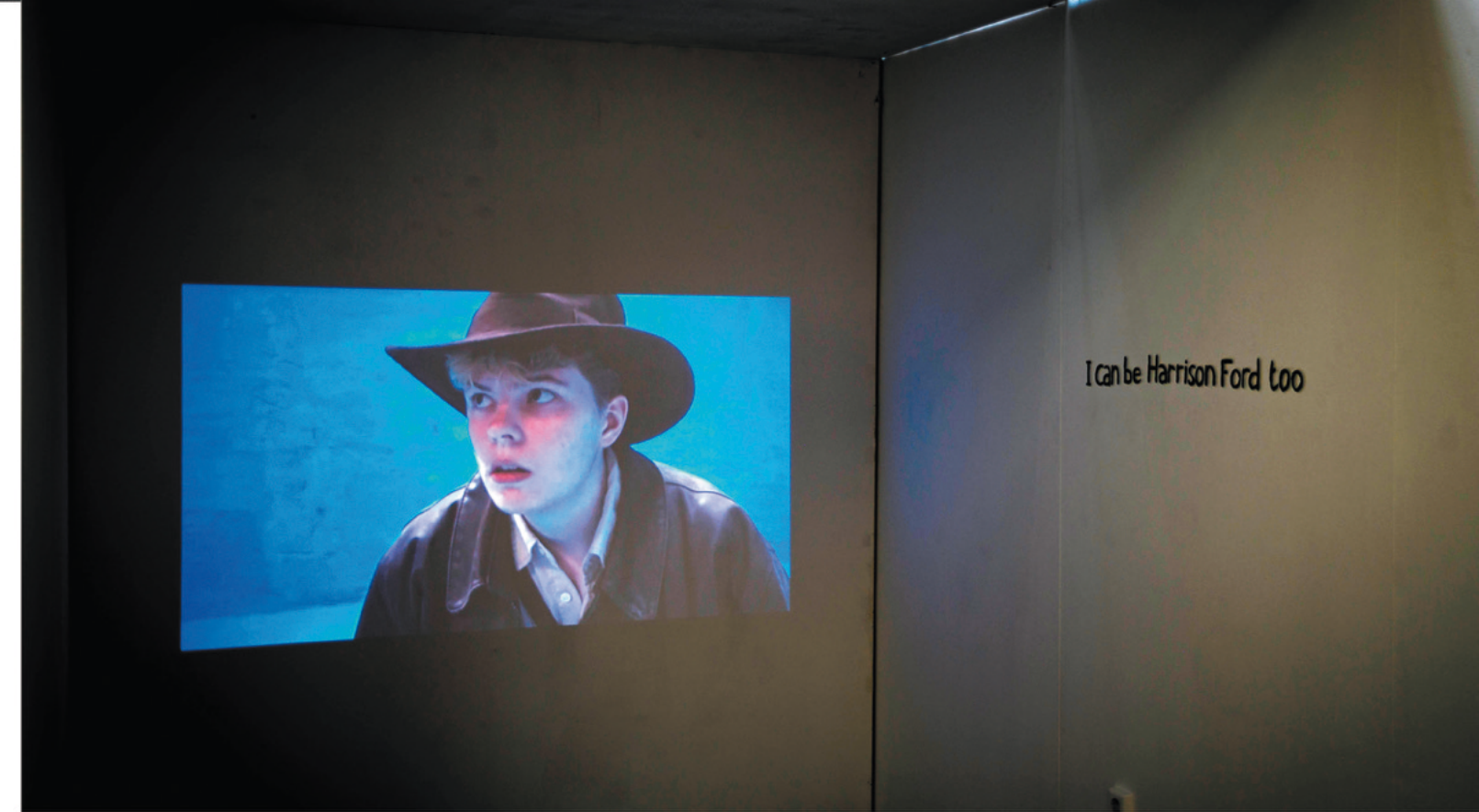
Still from - installation view of I can be Harrison Ford too .