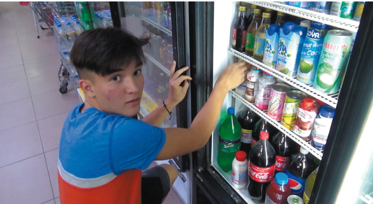
Still from Gregory is Productive , video 10.03 min. (boven)