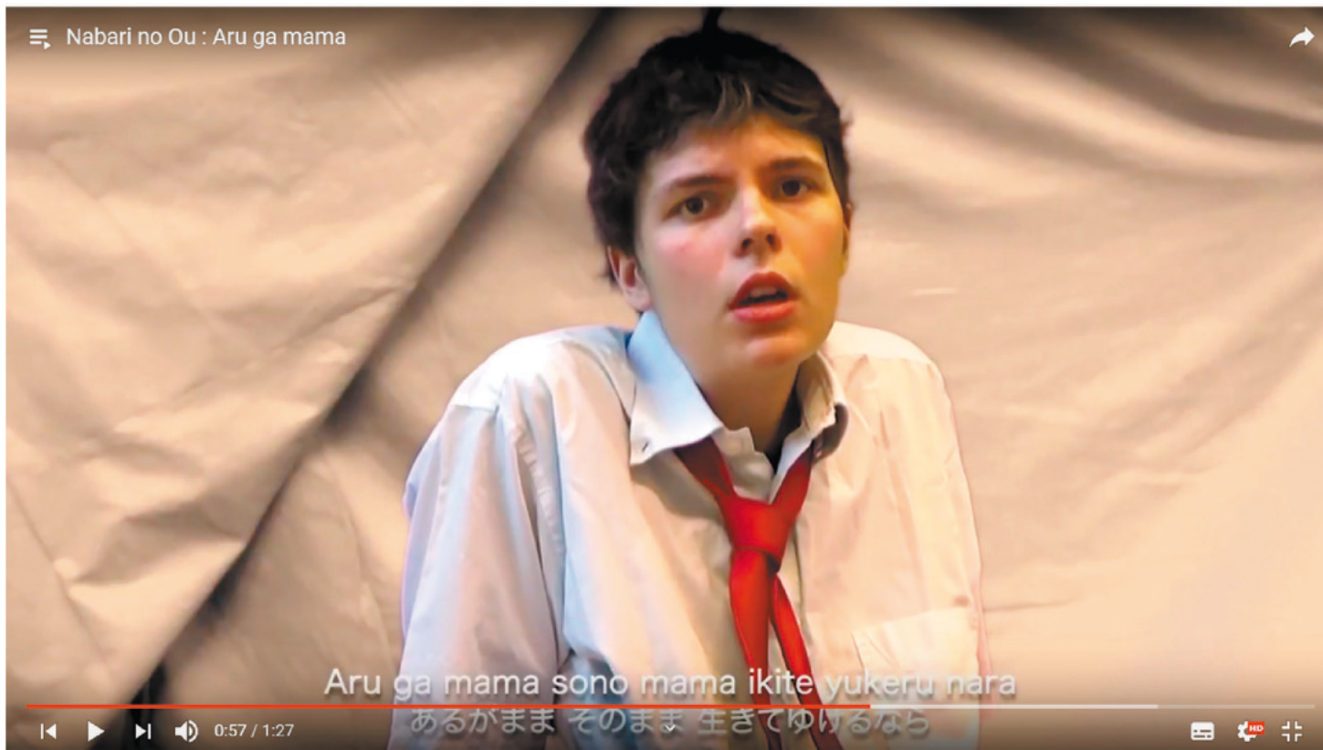
Still from Nabari no OU- Aru ga mama