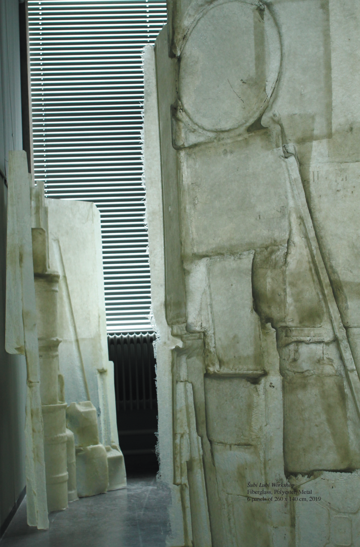
Šubi Lubi Workshop Fiberglass, Polyester, Metal 6 panels of 260 x 140 cm, 2019