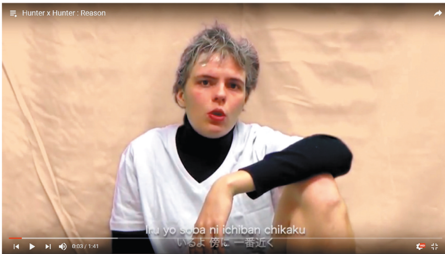
Still from Hunter x hunter - Reason