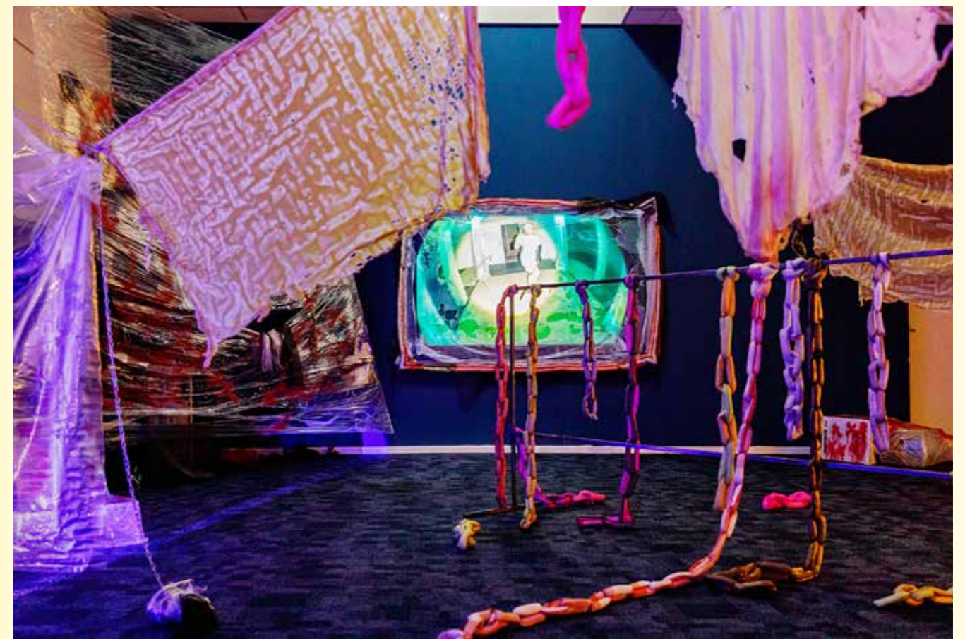
↑ BIMBO ZYGOTE installation, Multimedia, 2022.

Friese himself describes his art as 'elaborate' sculptures. He tries to create images of different realities. The main focus here is a time-based vision, where he changes the chronological arrangement of stories and objects. He uses moments or looks for stories related to the past - moments based on our history. In this context, he combines 'real' images of an already bygone reality with fiction. These fictional moments in turn refer to reality or are at least strongly connected to it, making the viewer's experience hover somewhere between fact and fiction. At best, viewers find themselves in a situation where both the known and the unknown must be explored, almost like in a dream world.