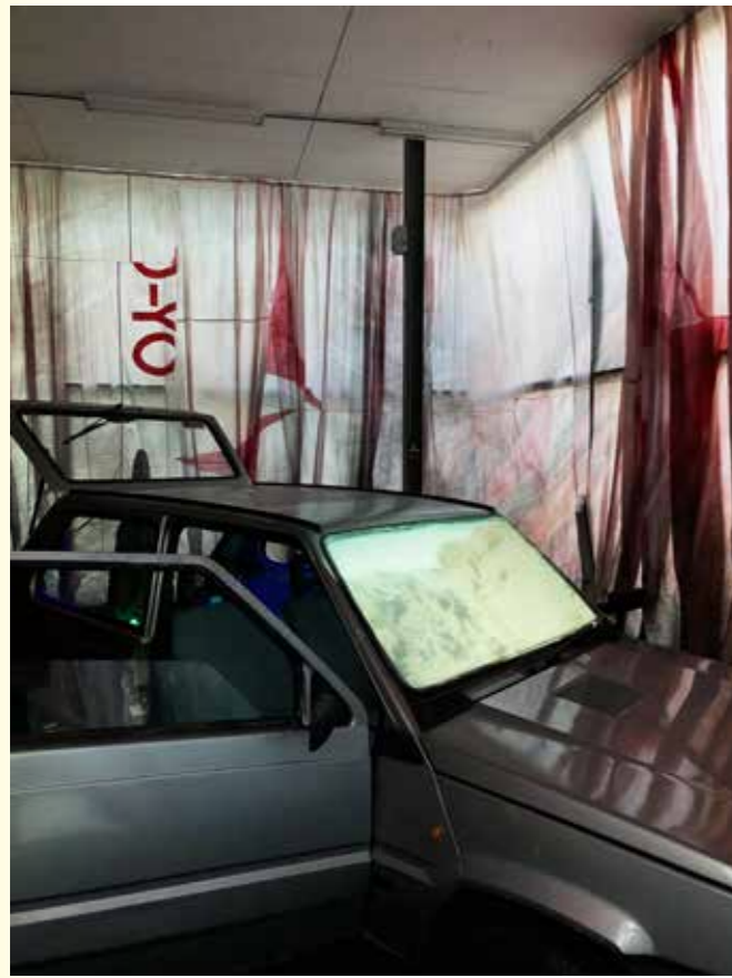
↑ → Accidental glass , installation, 2022