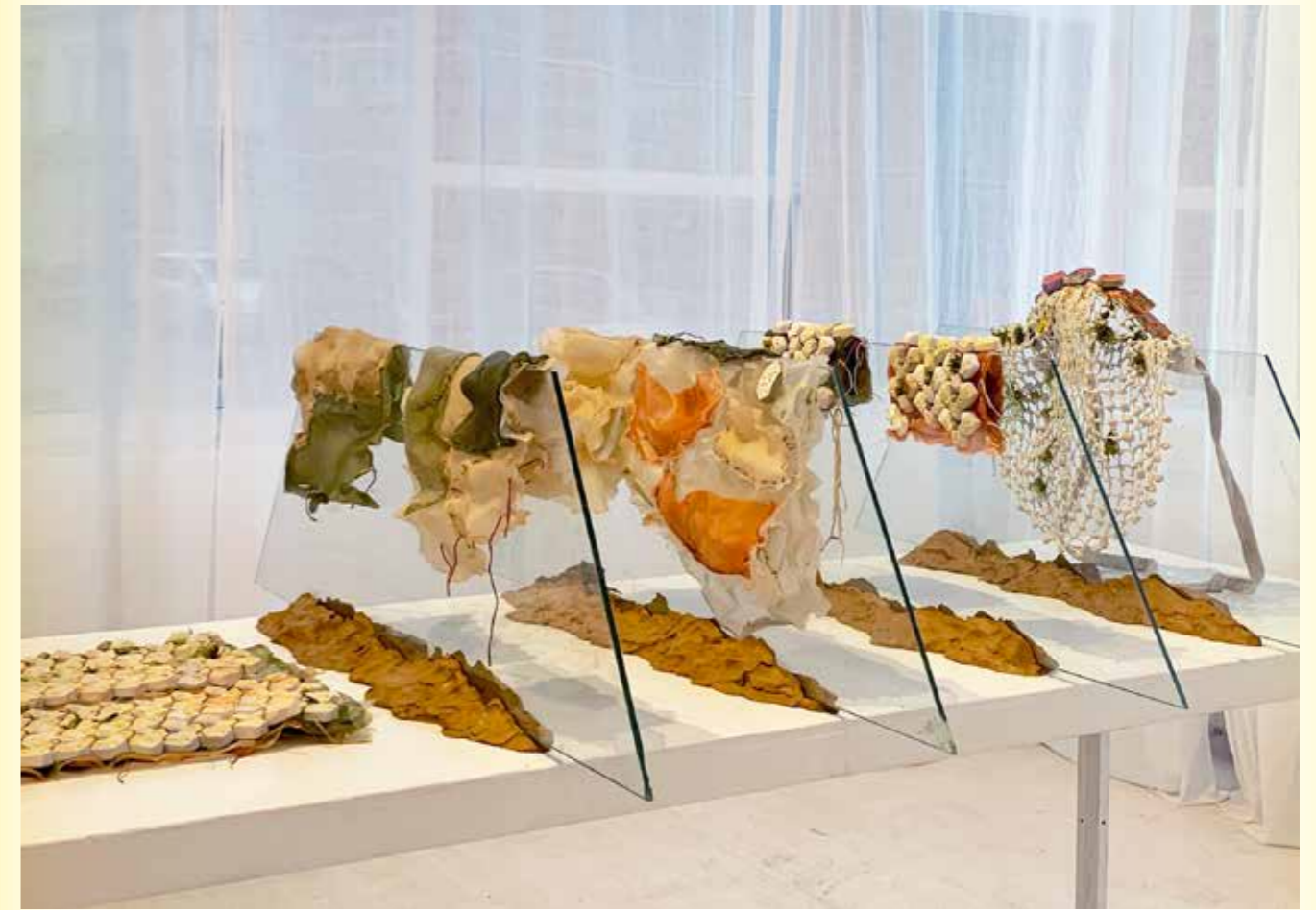
↑ The Walking Garden , Gypsum, agar agar bioplastic, cotton, natural pigment, Formatted for women's size 32, 2022

Out of her love for this material, Santana creates spatial art installations in which a variety of media, as well as other materials, come together. Her installations bring to mind absurd, apocalyptic worlds that seem to exist far from our own reality. Her found (film) images are so bizarre that they are more reminiscent of scenes from a science fiction film than the filming of reality. Nevertheless, all the material she works with is 'real'. Such as images of nuclear explosions, natural disturbances and Cold War test blasts.