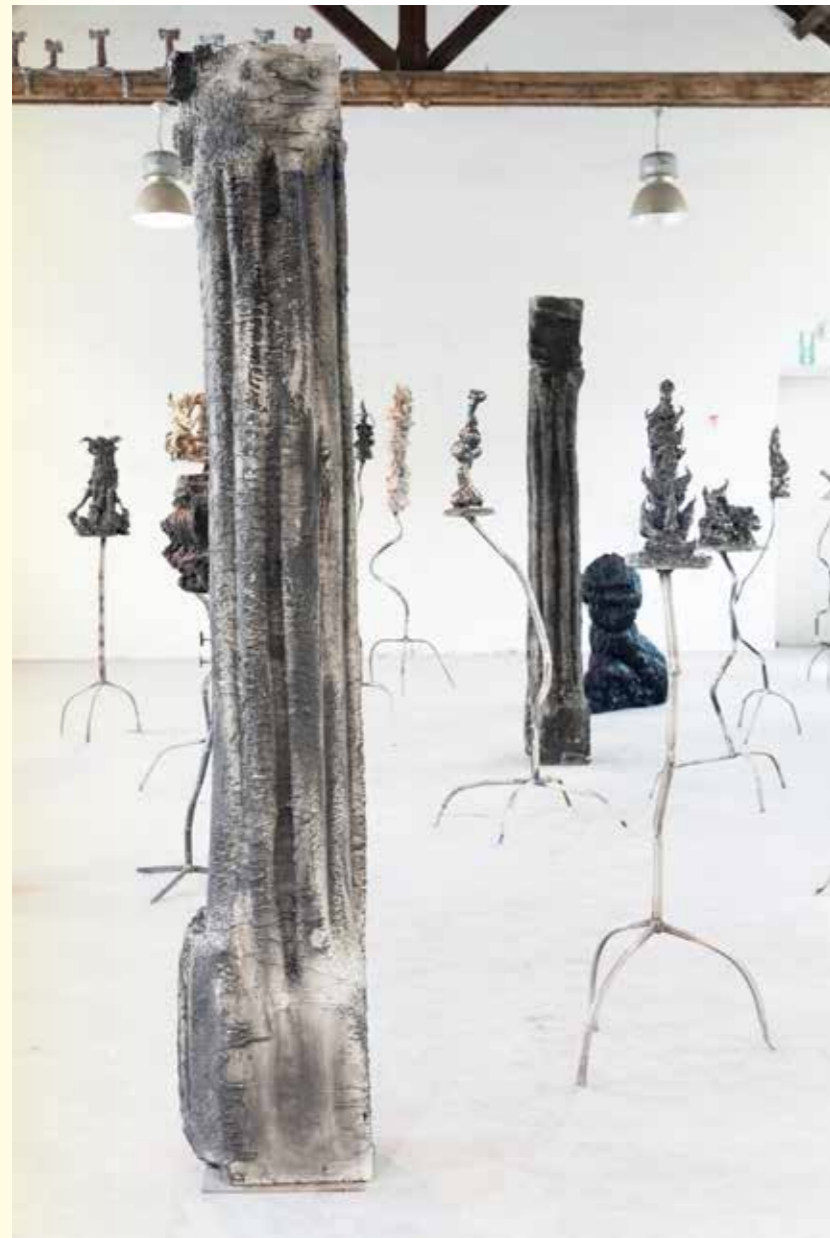
← Overview of Graduationshow 2022 Daan Peeters at Royal Academy of Fine Arts Antwerp. untiled , ceramics, steel and mixed media, various dimensions.