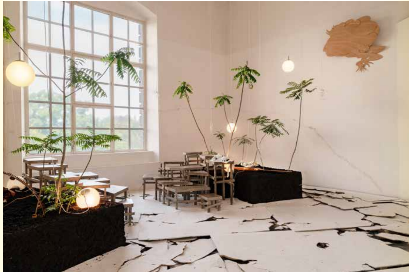
↑ Secret Garden x Beta Facts , Fabian Friese and Nayun Yang, Various materials, Various dimensions, 2022