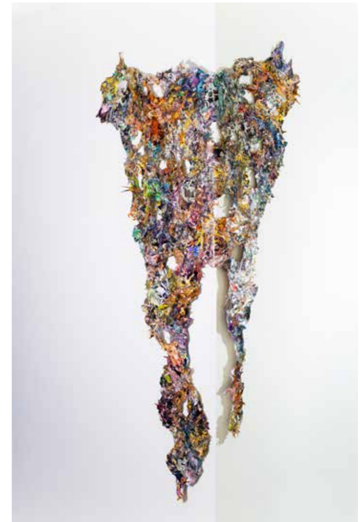
→ Spirits , collage, 2022.

Peeters is most satisfied when his work resembles a dying cathedral.