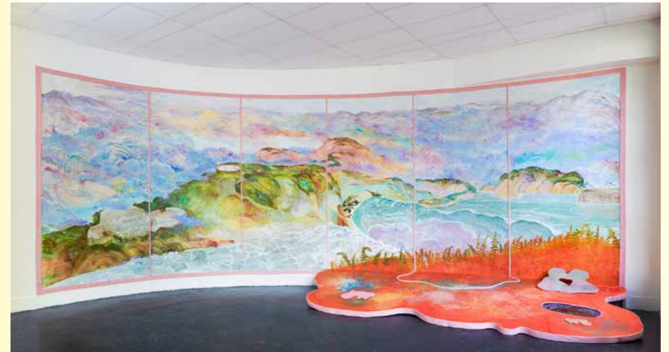
↑ Welcome to the Buffer Zone , Oil, acrylic on canvas, panel, Nitrile rubber, objet, sound, video 05:32, 350 x 1000 x 150 cm (dimensions variable), 2022.