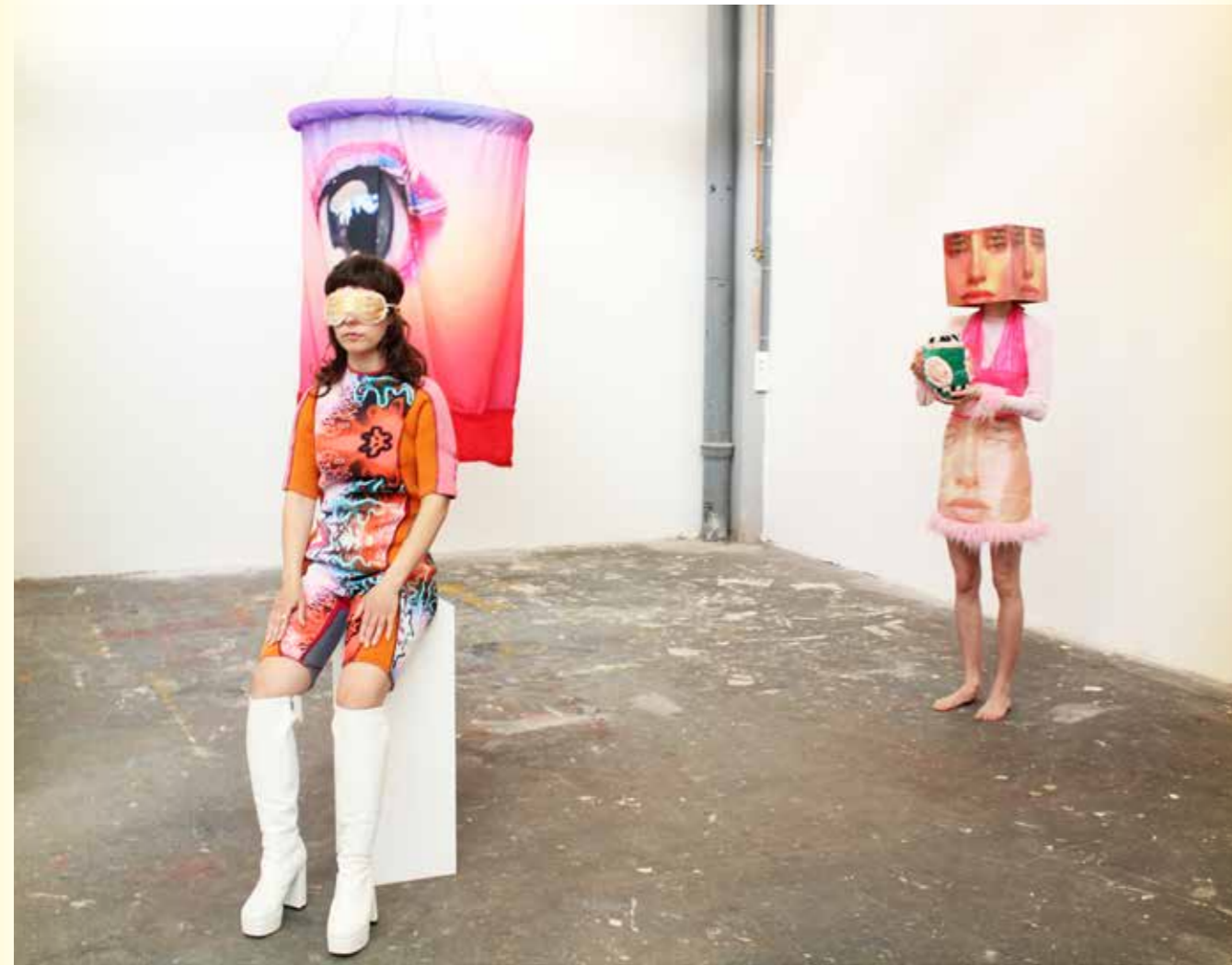
↑ Metopia , Performance Installation, 20:00 min, 2022

In essence, Pekala's work attempts to find a tangible form that connects to the digital world. A form that is fluid and not bound by physical laws, making them an alluring parallel dimension: a world where so much more is possible than in our physical reality. In times of crisis, one often tends to want to escape from the problems of our world. Pekala's work makes an attempt to avoid this tendency.