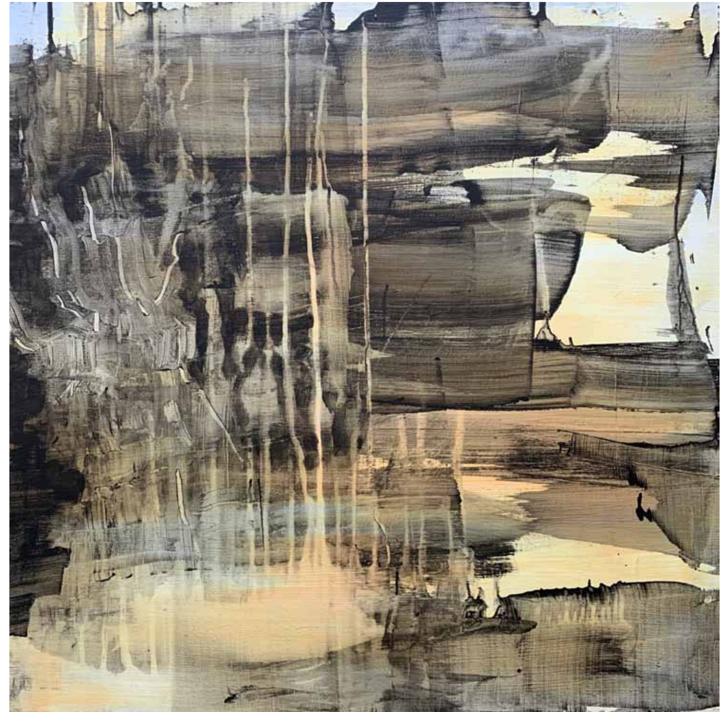
Hans Everaert, Deep Time series , 70 x 70, acrylics on canvas, 2019

"Mijn werk gaat fundamenteel over schilderen. Eerst, voordat het iets anders is, is een schilderij een object. Ik ben gefascineerd door de manier waarop deze objecten, die men schilderijen noemt, een andere soort betekenis lijken te hebben dan overige objecten: Ze zijn in staat te spreken over dingen buiten zichzelf. Ik ben me bewust van het feit dat naast object een schilderij tegelijkertijd als een afbeelding fungeert en dat er een interessante spanning ontstaat in het werk wanneer men probeert evenveel gewicht toe te kennen aan zowel de afbeelding als het object. Daarbij vergeet ik nooit dat het woord 'schilderen' ook als werkwoord moet worden opgevat. Dat wil zeggen: het aanbrengen van verf op een oppervlak. De manier waarop dit gebeurt heeft grote invloed op de manier waarop betekenis wordt verleend in het werk. Soms is dit verfproces éigenlijk het onderwerp."