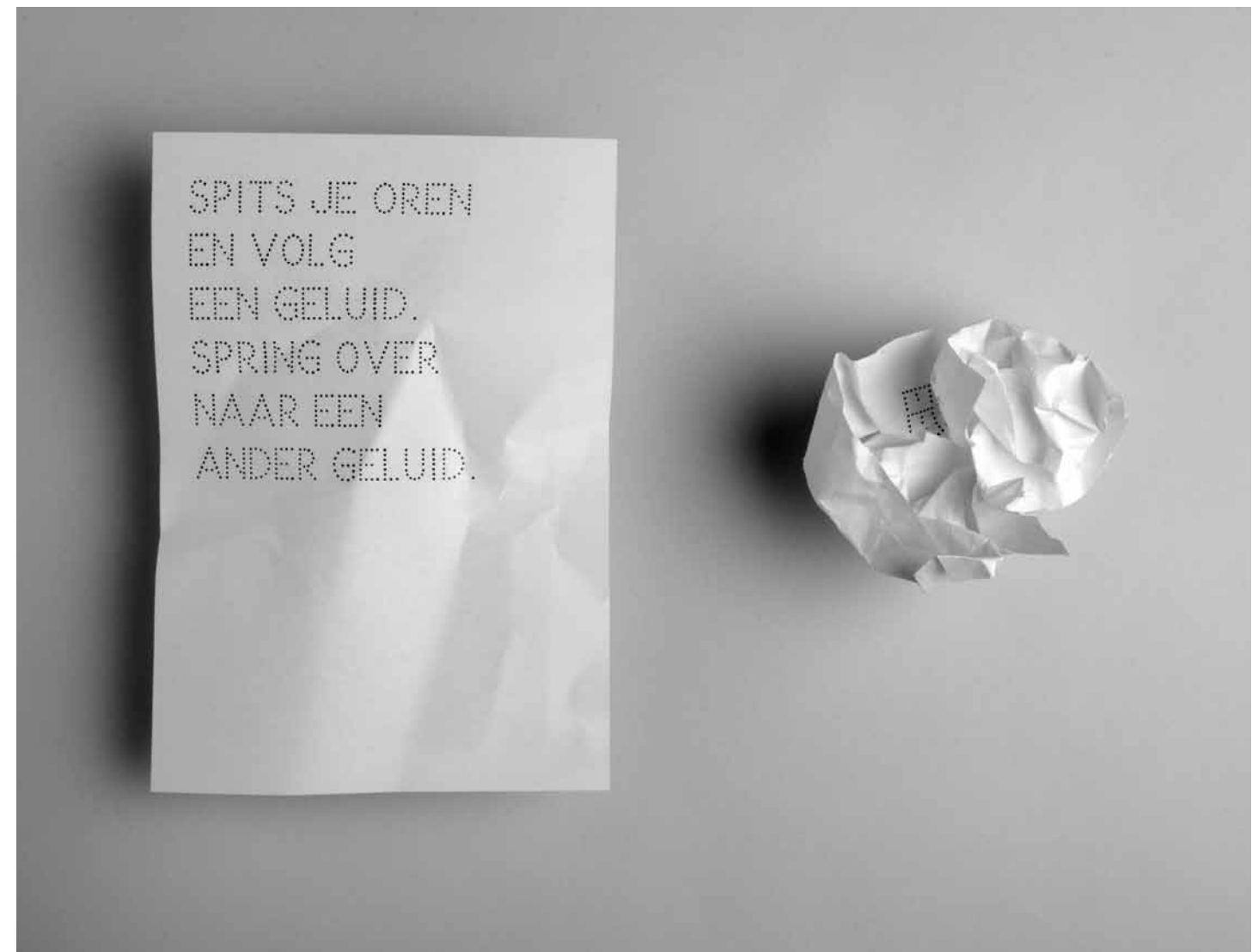
Isolde Venrooy, Traveller