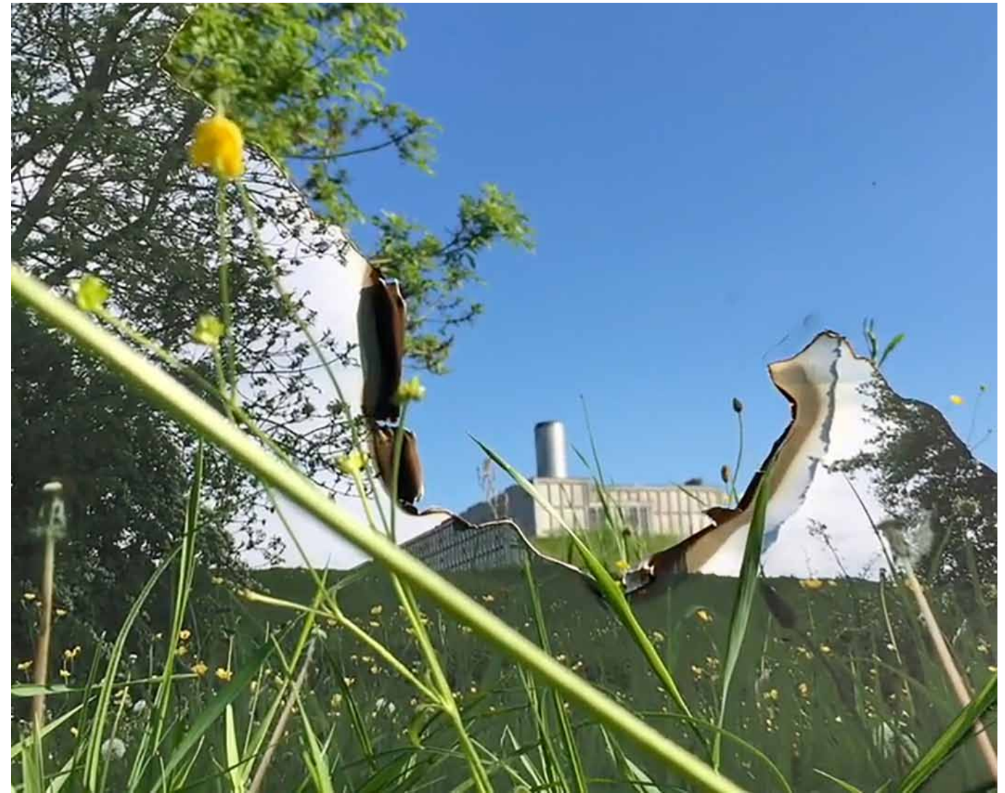
Karlijn Janssen, Sunburn , 2017 / Video-still from video 00:03:15 (loop)