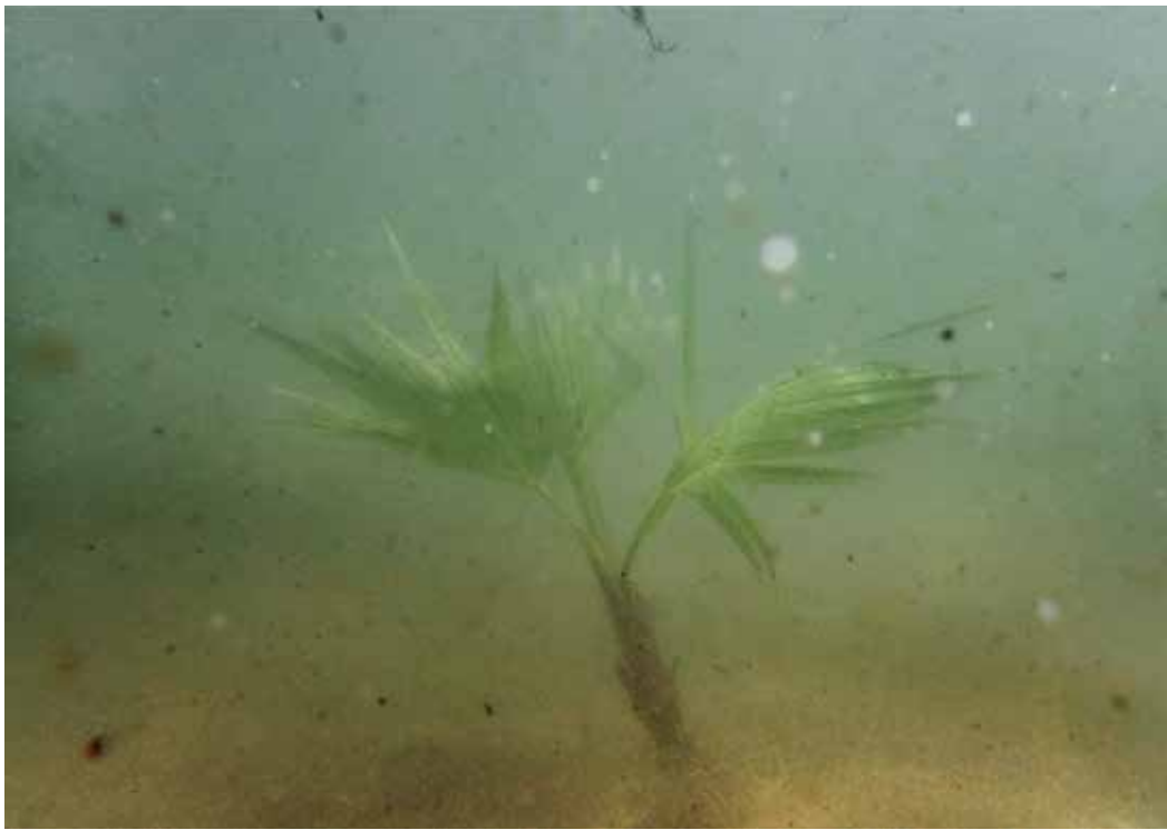
Annegret Kellner Force Majeure 2014 videoloop