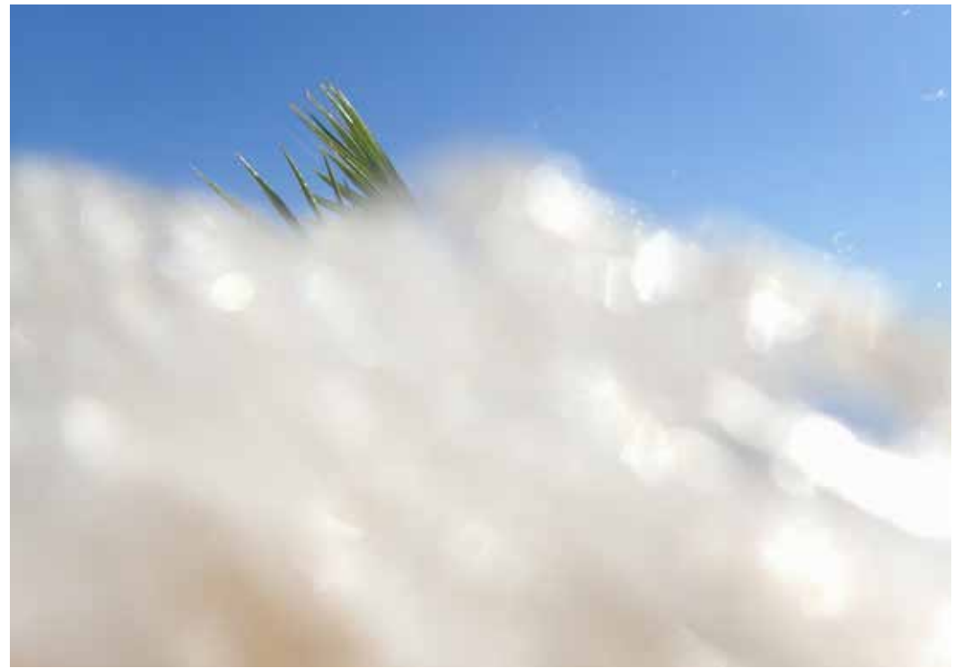
Annegret Kellner Vigor 2015 goudpalm, powerplate approx. 120 cm.