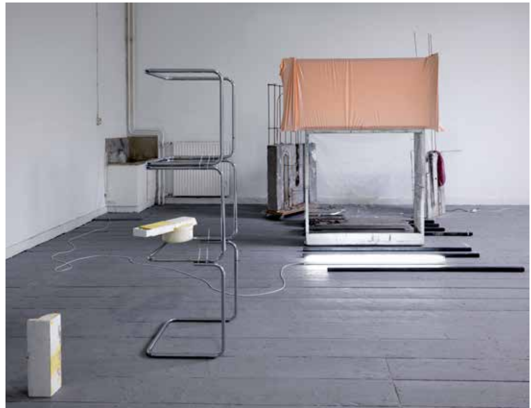
Evita Vasiljeva Thermodynamic Pain and Energy Bank 2016 mixed media / installation view solo exhibition, De Ateliers, Amsterdam