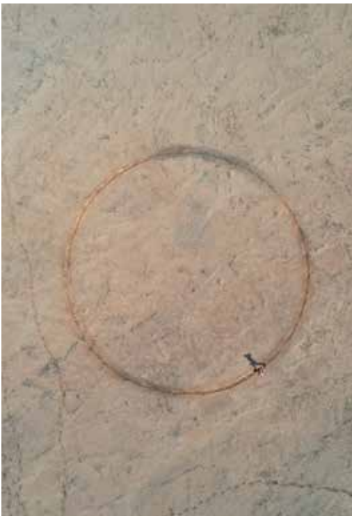
achterkant cover Jeroen Jongeleen Divided By Four 2019